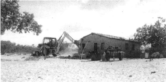
Nur noch ein Schutthaufen bleibt vom Lebenswerk der Klein- bauernfamilie übrig

rungswerk begingen nahmen den Bewohnern Ihre Aus- weise und die Schlüssel ihrer Fahrzeuge ab. Die Bewoh- ner mussten ohnmächtig zusehen.