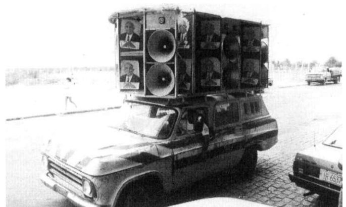
„Carro de som“

Es ist sehr schwer, sich in diesen Zeiten der Politik zu entziehen, da die Menschen extrem polarisiert sind. Aber nicht in einer Art und Weise wie in Deutschland. Sie le-