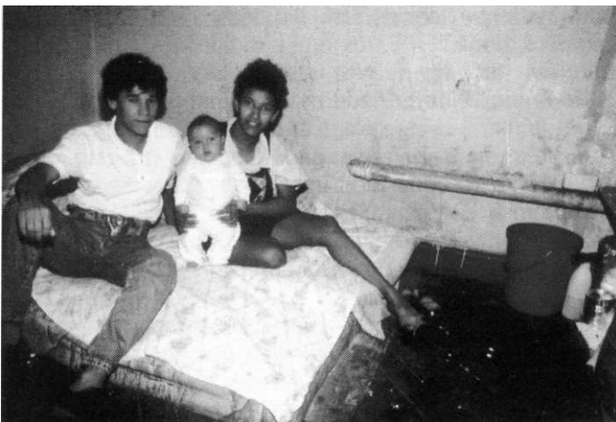
9 m 2 Wohnfläche im Keller, zwei Matratzen, ein Spülstein und ein Gasherd - eine Cortiço-Wohnung für fünf Personen

Verwahrloste alte Mietkasernen, Cortiços genannt, säumen den Platz. Tausende Menschen „wohnen“ hier. Bis zu einem Dutzend von ihnen teilen sich ein normales Zimmer. In den Kellerräumen ist es nicht anders. Die Hierarchie der Mittellosigkeit bestimmt, wer im Dunkel und wer im Licht eingepfercht leben darf.